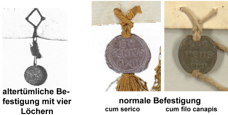
altertümliche Befestigung mit vier Löchern